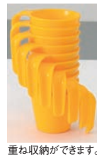
重ね収納ができます。