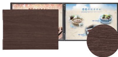
⑭シンビ メニューブック LS-13 ㊦