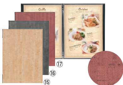
シンビ コルク調メニューブック CORK-301 ㊦