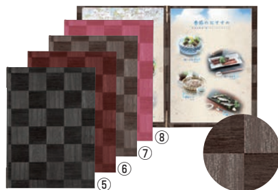
シンビ メニューブック LS-112 ㊦