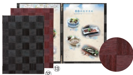
シンビ メニューブック LS-115 ㊦