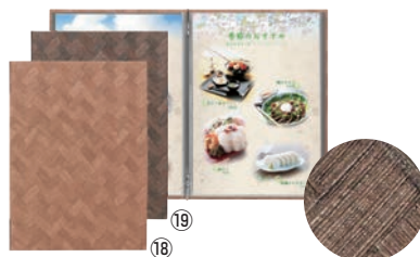
シンビ メニューブック LS-707 ㊦