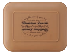
ライトブラウン 蓋