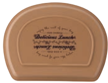
ライトブラウン 蓋