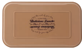
ライトブラウン 蓋