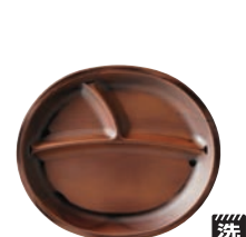
⑬耐熱ヴィラプレート チーク刷毛目