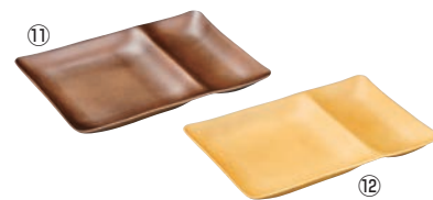
ワンセットプレート