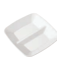
⑲メラミン ペアスクエアプレート 白 SS-170-W