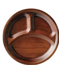
⑭耐熱サークルビュッフェプレート チーク刷毛目