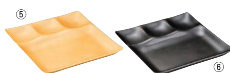
スリーセットプレート