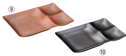
ツーセットプレート