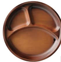
⑮耐熱ロコモコプレート チーク刷毛目