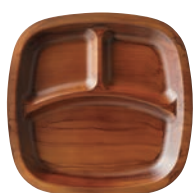
⑱耐熱フィットビュッフェプレート チーク刷毛目