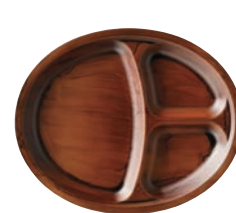
⑯耐熱オーバルビュッフェプレート チーク刷毛目