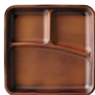
⑰耐熱カリブプレート チーク刷毛目