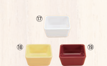
スクエアパーツ・ポーション 1/9 M-2391