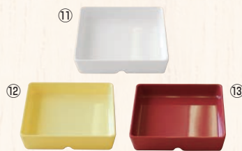
スクエアパーツ・ポーション 4/9 M-2394