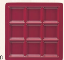
スクエアプレート 9仕切皿 M-2350