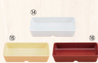
スクエアパーツ・ポーション 2/9 M-2392