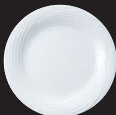
② 27cmプレート BA200-201 洗