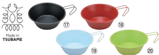
18-8 シェラカップ 目盛付