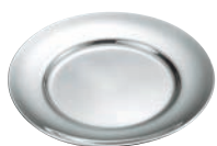
①IKD 18-8 ライス皿