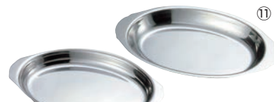
IKD 18-8 グラタン皿 9インチ