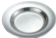
②IKD 18-8 スープ皿 9インチ