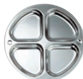
⑭K 18-8 4切ランチ皿