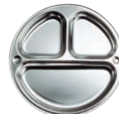
⑮K 18-8 3切ランチ皿