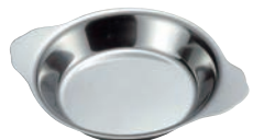
⑫IKD 18-8 丸グラタン皿 6½インチ