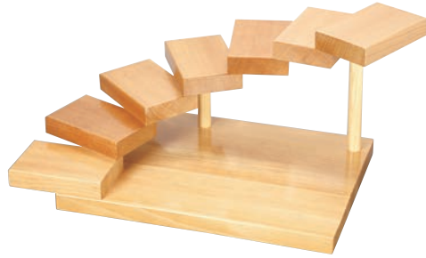
①段々(七段) 32360 加直A