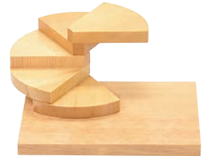
⑥回旋・角ベース(五段) 35399 加直A