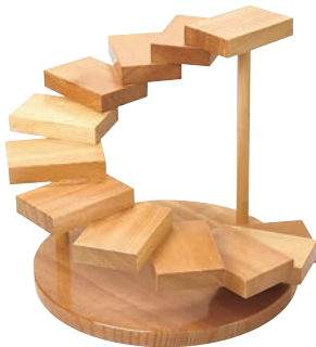
③螺旋(十二段) 35396 加直A