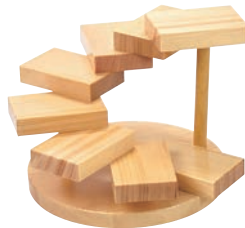
④螺旋(八段) 35397 加直A