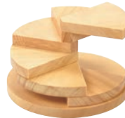
⑤回旋・丸ベース(六段) 35398 加直A