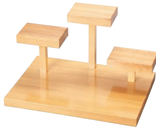
②遊山(三山) 32361 加直A