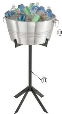
⑩2重ドリンククーラーバケツ