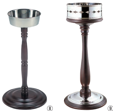
⑧SW 木製 シャンパンクーラー スタンド