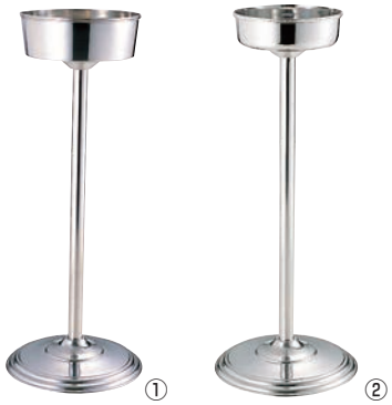
UK 18-8 シャンパンクーラー スタンド