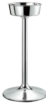
③SW 18-8 巻測 シャンパンクーラー スタンド