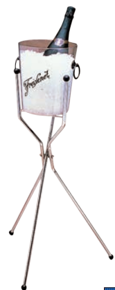
⑫キャンプ ワインクーラースタンド WCS30