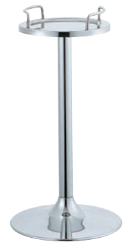
④SW 18-8 ワイヤー シャンパンクーラー スタンド