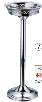
⑦TY 18-8 シャンパンクーラー スタンド