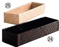
パンダンカトラリーバスケット