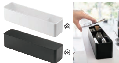
蓋付きカトラリーケース タワー ロング