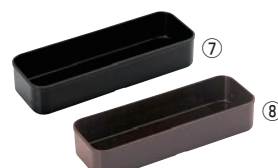
ABS カトラリーBOX 小