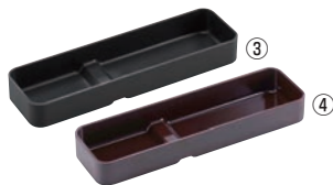
ABS 段付カトラリーBOX 小