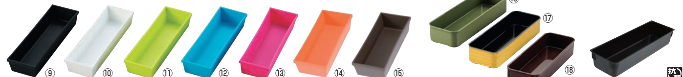
マットカトラリーケース