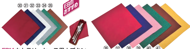
EBM カトラリーケース用ナプキン (10枚入)