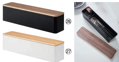
蓋付きカトラリーケース リン ロング