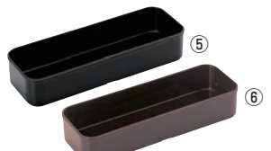
ABS カトラリーBOX 大