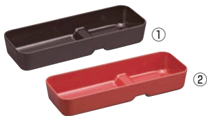
ABS 段付カトラリーBOX 大