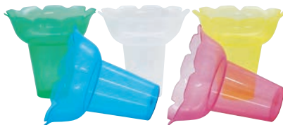
⑪PP フラワー氷カップ 500入 (5色×100)

口径φ86×H83(310cc) 材質:バーンハルプ100% 内面ポリエチレンラミネート加工 ●かき氷の他にも、からあげ、フライドポテトなどにも使えます。 ●青・赤・黄が約30ヶずつ入っています。 ●若干数量のバラつきがあります。