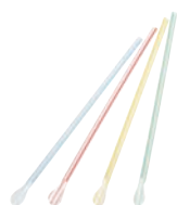
⑱スプーンストロー裸 (500本入)