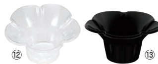
ミニフルールカップ (80入)

口径φ127×45×H120(400cc) 材質:PP ●かき氷用のカップです。5色アソートです。