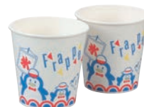
⑨かき氷カップ 紙製 (1,500入) SM-400