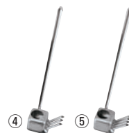
EBM 18-8 ウナギタレカケ