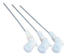
⑧ハンディシャワー 3本組

容量:1ℓ φ80×320 ●容器にシャワーが付いて、楽にカップにミツをかけることができます。