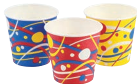
⑩緑日小町カップ (90入) SV-311EN