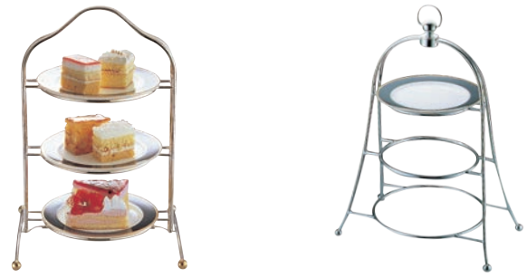
③UK 18-8 アフタヌーンティー スタンド