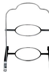
⑩ミスタースリム 18-8 ハイティースタンド 2段 MR-415