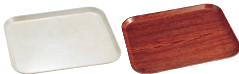
⑬ アンチークパーチメント(A/P)