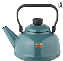
ソリッドホーローケトル