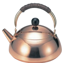
⑥銅コスミックケトル S-820