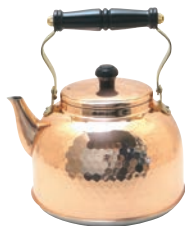
①銅槌目入電磁ケトル