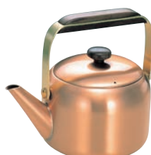
⑤銅ギャルソンケトル GS-1606