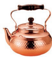
③銅槌目入湯沸かし SC-2007