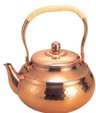
④銅槌目入ニュータイプケトル SC-2009