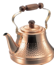
⑦銅クラッシーケトル