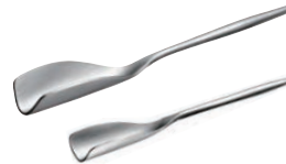
⑭ くるりとハチミツスプーン ㊦

165×245×H342 材質:ABS ●ビュッフェやレストランのドリンクバー、カラオケ店などのアミューズメント施設におすすめです。