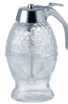
⑯ ガラス ハニーディスペンサー ㊦