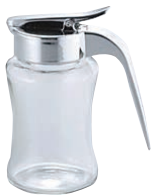
⑮ ガラス スリム ハニージャー ㊦