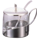
② ガラス シュガーポット No.8078 ㊦