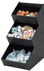
⑬ ポーションオーガナイザー 3段 ㊦