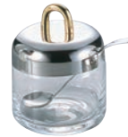
③ ガラス シュガーポット No.8005 スキ ㊦