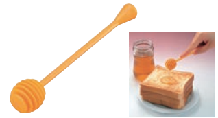
⑲ ハチミツスプーン ㊦