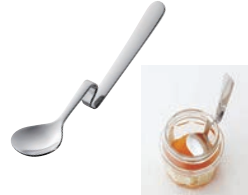
⑰ 18-8 ハニースプーン 縦型 ㊦