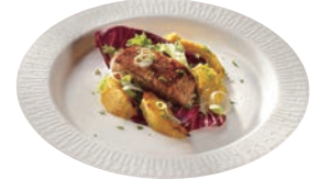
⑧パルプ ラウンドプレート 270mm ホワイト (50入) ㉕ ㉖