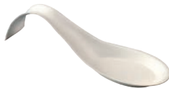
⑫パルプ カーブハンドル スプーン (50入) ㉕