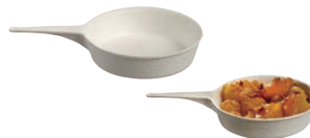
⑮パルプ エスコフィエ フライパン ミニ 25ml PLA (50入) ㉕