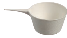
⑯パルプ エスコフィエ クッキングパン 50ml PLA (50入) ㉕