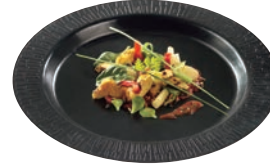
⑦パルプ ラウンドプレート 270mm PLA ブラック (50入) ㉕