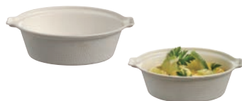
⑭パルプ エスコフィエ ココット 50ml PLA (50入) ㉕