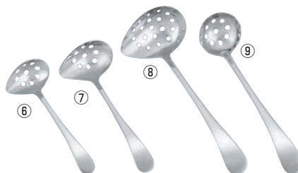
18-8 リプル ピアスト&サービングスプーン 72