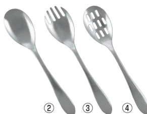
18-8 ビュッフェサーバー