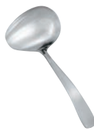
⑭18-8 ライラック 横口 調味レードル