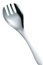
①18-8 便利小物シリーズ 盛りつけフォーク