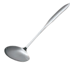
⑱18-8 ワンピース 煮物煮魚取りターナー 72

●食べやすい大きさにカットし、そのまますくって取り分けができる幅広いのナイフです。