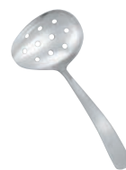
⑮18-8 ライラック 横口穴明 ソースレードル