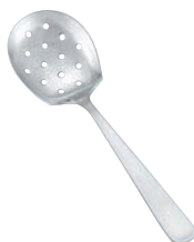
⑯18-8 ライラック 穴明 サービススプーン