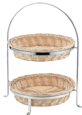
⑦SW 籐カゴスタンド 2段