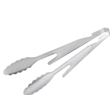
⑨EBM 18-0 スリーウェイトング