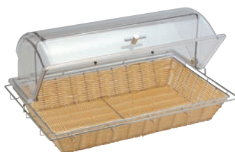
②角型 カバー付 バスケット