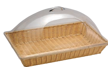
③角型 カバー付 バスケット