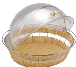
④丸型 カバー付 バスケット