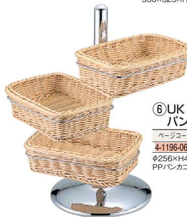
⑥UK 18-8 PP 角 パンカゴスタンド