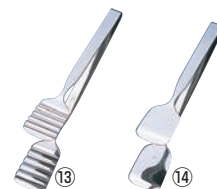
ZY 18-0 ブレッドトンガ #2000