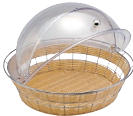
⑤丸型 カバー付 バスケット