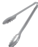
⑩EBM 18-0 バネ無万能トンガ (異物混入対策用)