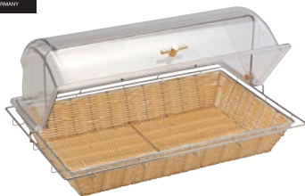
①角型 カバー付 バスケット

材質: カバー/ポリカーボネイト バスケット/ポリプロピレン(耐熱温度120℃)