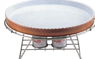
⑥EBM 18-8 ロイヤルスタンド 丸型