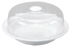
①EBM コンパクト IH 丸チェアファー 13