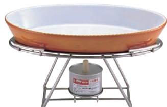
④EBM 18-8 ロイヤルスタンド 小判型