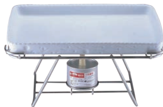
⑤EBM 18-8 ロイヤルスタンド 角型