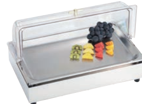
③CP-520 (HPC) 74