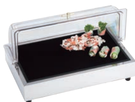
②CP-520 (GKC) 74