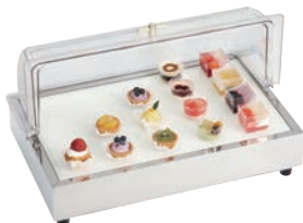
①CP-520 (GWC) 74