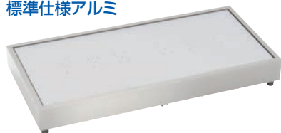
⑩タイジクールプレート CP-940 77