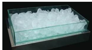
⑧クールプレート用アイスボックスのみ 74