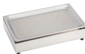
⑥CP-520 (HP) 74