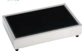
⑤CP-520 (GK) ブラック 74