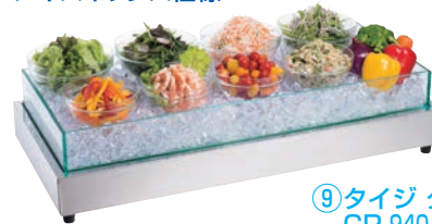
⑨タイジクールプレート CP-940 IB 77