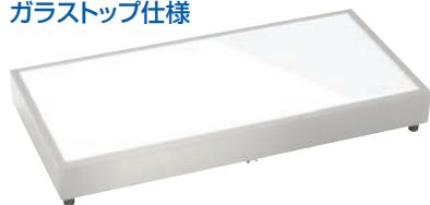
⑫タイジクールプレート CP-940 GW ホワイト 77