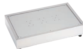
⑦CP-520 (N) 74