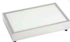
④CP-520 (GW) ホワイト 74