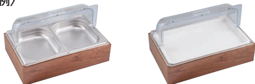
中鍋プロシェフ ガストロノームパン 1/2 中鍋ロイヤル ガストロノームパン 1/1