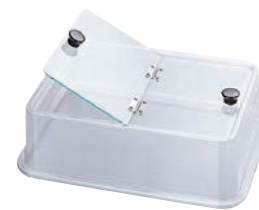
⑧タイジ ホットシステム HS-12N 専用 フードカバー

電源:単相100V 50/60Hz 720W 温度調節:40℃~80℃サーモ可変式 外寸:427×297×H200 内寸:372×262×H114 専用バット容量:12ℓ(カップ収容数 約20個) 重量:6kg ●多用途に使える電気湯せん器。温度調節機能でお好みの温度に設定できます。