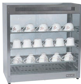
②ニッセイ 電気カップウォーマー (ドライ式) NWC-63

電源:単相100V 268W(ヒーター240W+照明灯28W) 温度調節:サーモスタット40℃~70℃ 外寸:600×300×H415 片面スライド強化ガラス 棚板:(565×250)×2段 カップ収容数:約40個 重量:15kg ●珪球カップを最適に保温、コンパクトに収納できます。