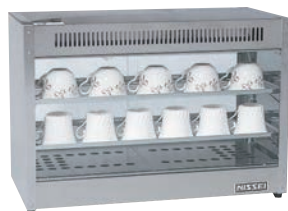
①ニッセイ 電気カップウォーマー (ドライ式) NWC-43