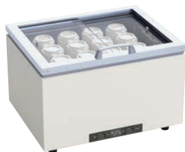
⑥タイジ カップウォーマー DA-23GS