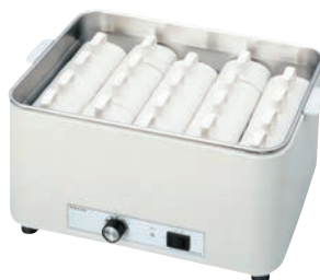
⑦タイジ カップウォーマー

電源:単相100V 50/60Hz 150W 温度調節:バイメタル式サーモスタット 安全装置:温度ヒューズ 庫内温度(標準温度):L(保温)約55℃ H(乾燥)約70℃ 外寸:445×390×H329 庫内寸法:383×288×H190 庫内容量:23ℓ(カップ収容数 25~45個) 重量:7.5kg