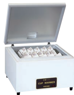
③ニッセイ カップウォーマー ドライ式 CW-42

電源:単相100V 268W(ヒーター240W+照明灯28W) 温度調節:サーモスタット40℃~70℃ 外寸:600×300×H615 片面スライド強化ガラス 棚板:(565×250mm)×3段 カップ収容数:約60個 重量:22kg ●珪球カップを最適に保温、コンパクトに収納できます。