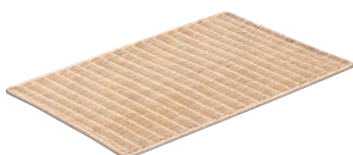
④ 籐製 パンスノコ 竹