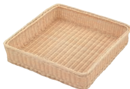
② 大型籐かご 竹