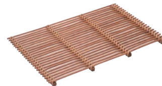
⑥ 籐製 スカシスノコ 茶