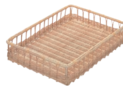
③ 籐製 大型パンカゴ 竹