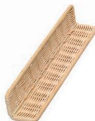
⑨ 籐製 L型仕切り板