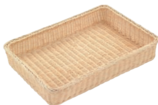
① 大型籐かご 竹