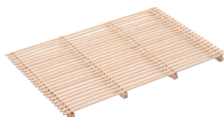
⑤ 籐製 スカシスノコ