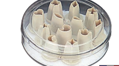
④ マトファー プラスチック抜型 79928 12pcsセット