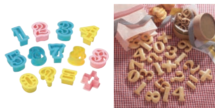
⑳ PCクッキー抜型 フィガ(数字) 13pcs No.1734