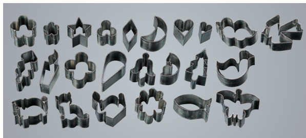
① マトファー 抜型 24pcsセット 79628