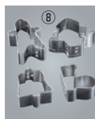
FK ブリキ クリスマス用 抜型