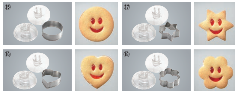
18-8 クッキー抜き型 にここフェイス