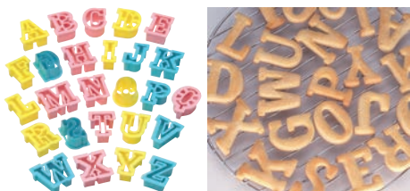
⑲ PCクッキー抜型 アルファベット 26pcs No.1733