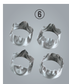
18-8 ビスケット 抜型