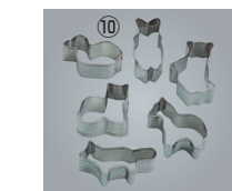
⑩ 18-8 ミニクッキー抜型 6pcsセット