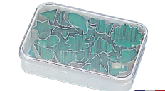
③ マトファー 抜型 15pcsセット 79627