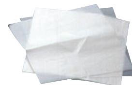
⑯カップケーキ用 敷紙 (30枚入) ㊦