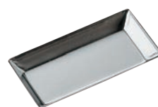
③ギルア タルト型 無地 長方形型 ㊦

内寸:68(45)×68(45)×H12 材質:スチール・クロムメッキ ●タルレット型に合わせて、パイが切りやすいように型の縁が刃状になっているので、生地を型に入れ、縁を指で押すだけできれいに生地がきれえます。