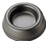
④ブラックセラコン フルーツケーキ型 丸型 ㊦

内寸:94(80)×46(32)×H11 材質:スチール・クロムメッキ ●タルレット型に合わせて、パイが切りやすいように型の縁が刃状になっているので、生地を型に入れ、縁を指で押すだけできれいに生地がきれえます。