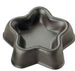
⑤ブラックセラコン フルーツケーキ型 星型 ㊦