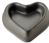
⑥ブラックセラコン フルーツケーキ型 ハート型 ㊦