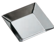
②ギルア タルト型 無地 正方形型 ㊦

内寸:φ73(φ53)×H11 材質:スチール・クロムメッキ ●タルレット型に合わせて、パイが切りやすいように型の縁が刃状になっているので、生地を型に入れ、縁を指で押すだけできれいに生地がきれえます。