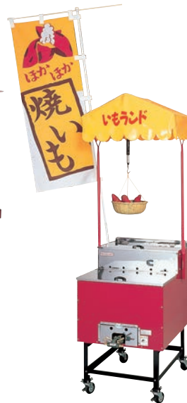
①ガス 焼きいも機 いもランド AY-500型 ㊦