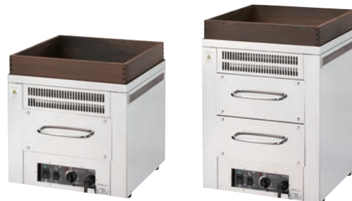
⑦遠赤外線 電気ホットロースター TEY-101 ㊦