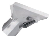
⑩アルミ ポテトスクープ