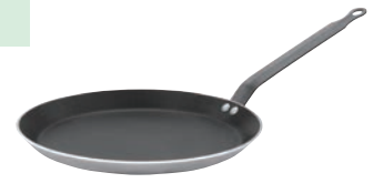
③デバイヤー アルミニウムスティック クレーパン 8185