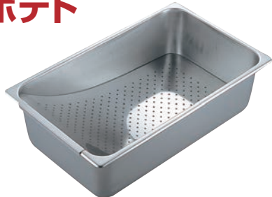
⑨18-8 イージーミキシング プレートセット 1/1