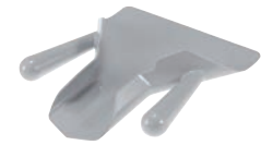
⑫トラエックス フレンチフライスクープ ダブルハンドル 3672