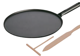
⑧ストウブ クレーパン 30cm 40509-526