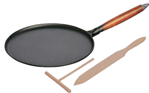
⑦ストウブ クレーパン 木柄 ブラック 28cm 40509-525