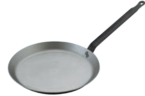
⑥マトファー 鉄 クレーパン