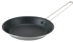
①EBM プロスタンダード 2PLY オムレツパン