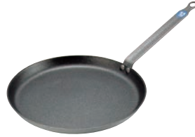
②ブウジャ アルミニウムスティック クレーパン 6661