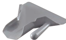
⑪トラエックス フレンチフライスクープ 右ハンドル 3670