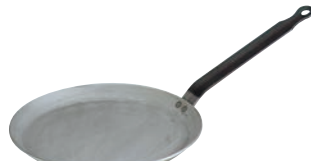
⑤デバイヤー 鉄 共柄 クレーパン 5120