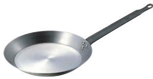
④SW 鉄 クレーパン