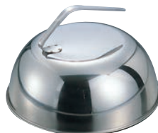
⑮ EBM 18-8 共柄 丸カバー 26cm