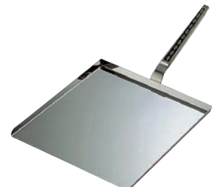
⑯ 18-0 モナカ柄 運搬具