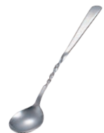
⑬ 18-0 お好み焼用 ネジレスプーン