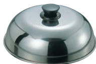
⑭ EBM 18-0 PC柄 丸カバー