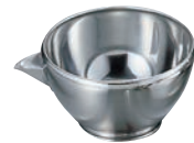
⑥ 18-8 片口 ボール