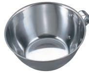
⑤ 18-0 お好みカップ

●目盛付 15cm目盛:200cc・400cc・600cc 18cm目盛:300cc・500cc・1,000cc 21cm目盛:500cc・1,000cc・1,500cc