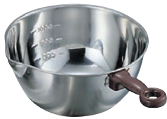
① 18-8 目盛付 手付 片口 ボール