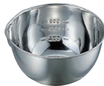
② 18-8 目盛付 片口 ボール

●目盛付 大目盛:500cc・1,000cc・1,500cc 中目盛:300cc・600cc・1,000cc 小目盛:200cc・400cc・600cc