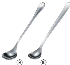
⑨ EBM 18-8 リモージュ ソーダスプーン