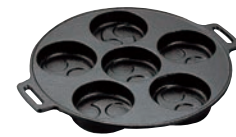
④アサヒ 鉄イモノ 巴焼器 切

外寸:175×200×380(木柄含む) 重量:2.3kg 材質:鉄イモノ ●具材がこぼれにくいよう工夫しました。