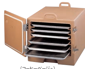
(コーヒー・ベージュ)

容積:5.74ℓ 重量:14.4kg キャリア用ハンドル付 レール間隔:54mm ●455×330×H25のシートパン小を8枚収納できます。 適用ドレーン:CD300、CD300H (P716-⑥⑦参照) 小 8枚