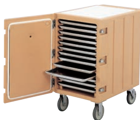
(コーヒー・ベージュ)