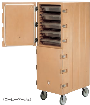
(コーヒー・ベージュ)