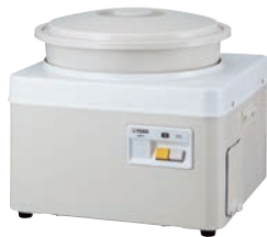
①タイガー 餅つき機 かじまん