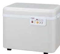
②タイガー 餅つき機 かじまん