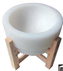
⑤プラスチック餅臼 (木台付)