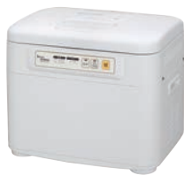
③マイコン餅つき機 かがみもち