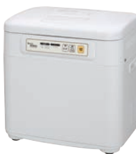
④マイコン餅つき機 かがみもち