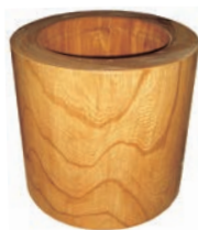
⑩手造り天然ケヤキ 臼