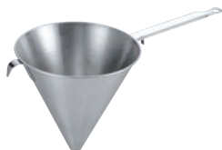
① デバイヤー 18-10 シノア 極細目