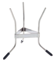
② デバイヤー シノア スタンド

サイズ:φ230×H220 柄長:200mm 穴径:φ0.8 ●板厚1mmの頑丈なポディーに細かい穴でスッキリ漉します。