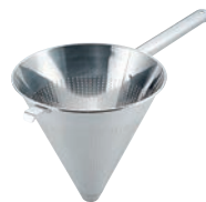
⑤ UK 18-8 パンチング スープ漉