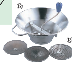
⑫ LT 18-10 ムーラン