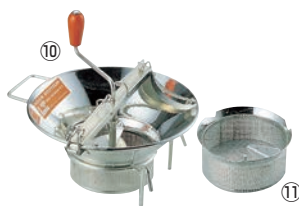
⑩ LT スズメッキ ムーラン