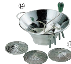
⑭ LT スズメッキ ムーラン

①310 ②140 ③130 ●丈夫なステンレスタイプ ●1.5mm, 2.5mm, 4mmの替刃3枚付