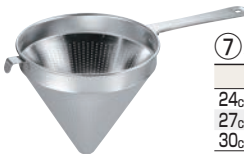
⑦ メロディ 18-8 スープ漉