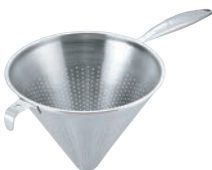
⑥ UK 18-8 片手コランダー (モナカハンドル)