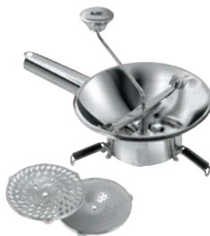
⑯ LT 18-10 ムーラン