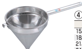
④ UK 18-8 スープ漉