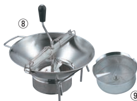
⑧ LT 18-10 ムーラン