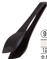
⑨ パン&ケーキトング 洗