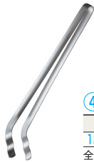
④ グリルトング ㊦