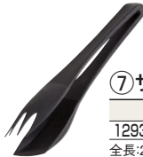
⑦ サービストング 洗