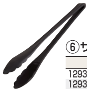
⑥ サラダトング 洗