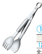
① ユニバーサルトング ㊦