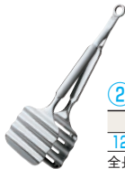
② アスパラガストング ㊦