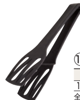
⑩ パン&ケーキトング(穴明) 洗