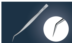
⑪ 18-0 ツル首ピンセット ㊦