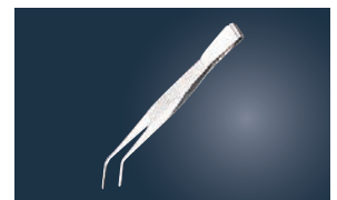
⑭ 18-0 先曲ピンセット