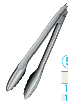
⑤ ロッキングトング ㊦