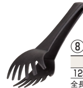
⑧ スパゲティトング 洗