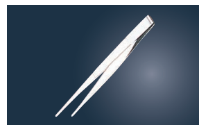
⑬ 18-0 ピンセット