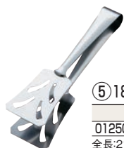
⑤ 18-10 トーストトング