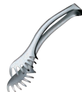
⑪ 18-10 バッフェ スパゲティトング