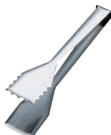
⑬ 18-10 バッフェ トング