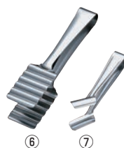
18-10 アスパラガストング