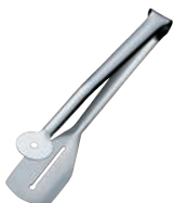
⑫ 18-10 バッフェ トーストトング