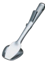
② 18-10 クリップ型 サービストング