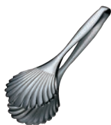
⑩ 18-10 シェル型 ブレードトング