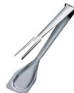
⑭ 18-10 バッフェ ミートトング