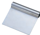
② リス 18-0 スケッパー