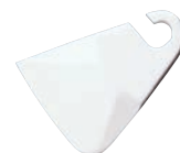
⑮ キッチンスクレーパー

外寸:90×150×10 耐熱温度:-40~280℃ ●ボール内の食材掻き出し等、さまざまな用途に使えます。 ●厚みがあり、力が入りやすい。