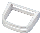
⑧ PC柄 パイブレンダー