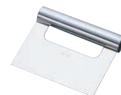
⑥ 18-0 スケッパー