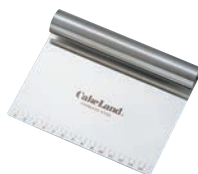
⑤ 18-0 目盛付 スケッパー