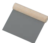
④ ブラックフィギュア スケッパー