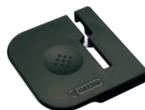
⑰京セラハサミ研ぎ器 HT-NBK 加