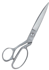
①オールステン ラシャ切鋏 240mm #4000