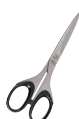
⑧シルキー オフィスシザー NBS-170 加