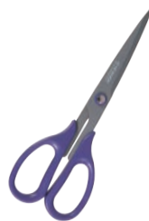
⑦シルキー 事務用バサミ ハインバノン BNT-185 加