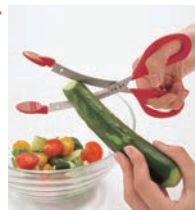
⑨トング付きキッチンハサミ DH2064 洗