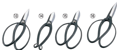
園芸用 ハサミ 加