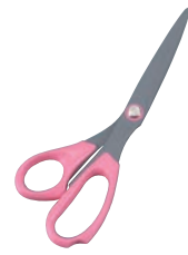
④ラシャ切ハサミ フッ素加工 K-210F