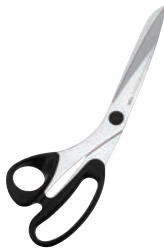
②ラシャ鋏 15101 加