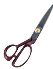
③ラシャ切りハサミ