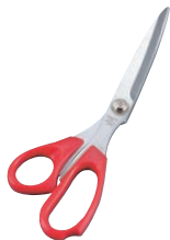
⑤ドレスシザー ギザ刃付 K-240C