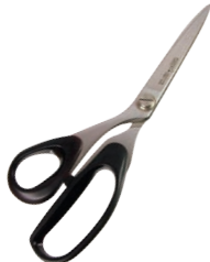
⑥シルキー 洋裁バサミ 加