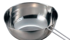
⑫ 18-8 手付ボール (口付目盛付)