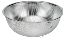
⑤ シェフズボール ステンレス足付パンチングボール (リング付)