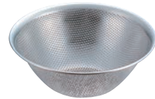
③ パンチングストレーナー 51

●パンチングストレーナーは、ステンレスボールと組合せて使えるようにサイズを設定してあります。 ※13cmのボールに合うストレーナーはありません。