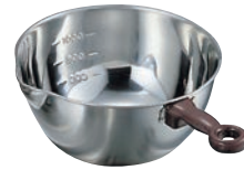
⑨ 18-8 目盛付 手付 片口 ボール