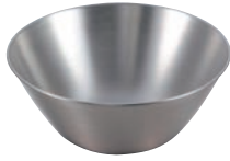
① ステンレスボール 51