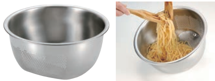
⑦ 3WAY 水切りボール

材質:網/18-8ステンレス 枠・トレー/18-0ステンレス ●麺、野菜の水きりや鍋もの等の、材料の盛り付けに最適です。