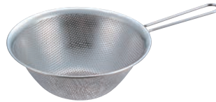
② 手付き パンチングストレーナー 51

●用途に応じ、小(13cm・16cm・19cm)はあまりご様に底が絞ってあり、中(23cm)はミキシングしやすい様に深めに曲線が工夫され、大(27cm)は洗い桶にも使える様大きめになっています。