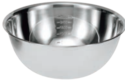
④ シェフズボール ステンレス深型ボール (目盛付)

●パンチングストレーナーは、ステンレスボールと組合せて使えるようにサイズを設定してあります。 ※13cmのボールに合うストレーナーはありません。