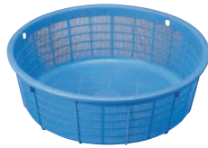
②リス PP 丸カゴ No.55 ㊦