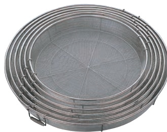
⑫BK 18-8 給食用手付 蒸しカゴ