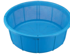
③セクスイ ザルカゴ #35 ㊦