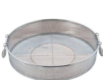
⑪UK 18-8 パンチング 手付 蒸しザル