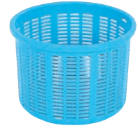
⑧サンコー 万能バスケット 2型 (浅型) ㊦