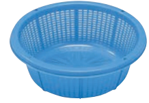
④サンコー バイスケツト #13 ㊦