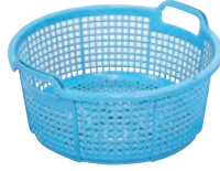
⑥サンコー 丸型 北海竜 ㊦