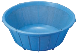
①リス PP バイスケツトⅡ ㊦