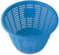
⑤セクスイ 万能カゴ #18 ㊦