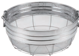
⑩18-8 取手付 広巾ザル (ミノ付)