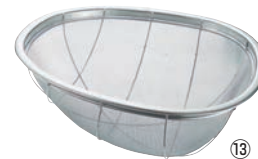
⑬BK 18-8 亀ザル