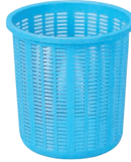
⑦サンコー 万能バスケット 1型 (深型) ㊦