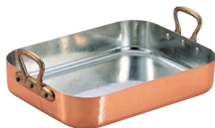
⑦ ムヴィエール 銅 ロティール 2155