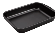
⑪ アルミテフロン加工 ブラジル ローストパン 22cm

ダイヤモンド粒子が入った ウェットコーティング ダイヤモンド粒子が入った ハードコーティング サンドブラストをかけた アルミダイキャスト