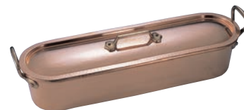
⑨ ムヴィエール 銅 ポワソニエ 2160