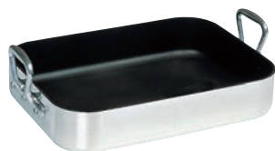
④ ムヴィエール シルバーストーン ロティール 9850