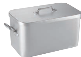
⑥ ムヴィエール アルミ プレゼール 1111