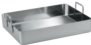
① デバイヤー イノックス ローストパン 3121

西洋料理に使われ、ロースト(蒸し焼き)する、ポイルする、オープンで焼く、大量食材の下ごしらえ、角型なので大容量の調理に適しています。大きい食材を切らずにそのまま調理できるのも利点の一つです。深型にスノコを合わせれば、蒸してそのまま取り出せます。