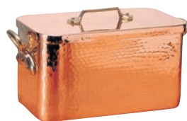
⑧ ムヴィエール 銅 プレゼール 2153