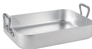
⑤ ムヴィエール アルミ ロティール 1113