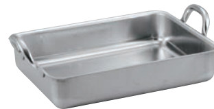
③ マトファー/ブウジャ 18-10 手付 ローストパン7135