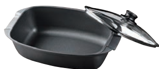
⑩ スイスダイヤモンド ロースター (蓋付き)