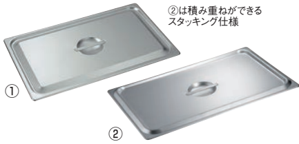
②は積み重ねができる スタッキング仕様