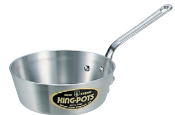
⑥ニューキング アルミ テーパー鍋 (目盛付)