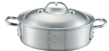
③ニューキング アルミ 外輪鍋 (目盛付)