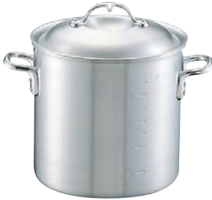
①ニューキング アルミ 寸胴鍋 (目盛付)