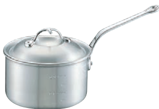
④ニューキング アルミ 深型 片手鍋 (目盛付)