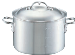
②ニューキング アルミ 半寸胴鍋 (目盛付)