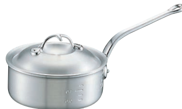
⑤ニューキング アルミ 浅型 片手鍋 (目盛付)