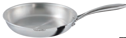
⑥ フライパン (フタ無)