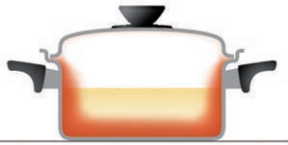
全面多層構造のビタクラフト 側面にも効率よく熱が伝導