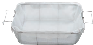
⑤マイクロオイルフィルター 耐熱PCフライヤー 油缶用カゴ用