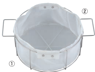
①EBM オイルフィルター 油缶20ℓ用