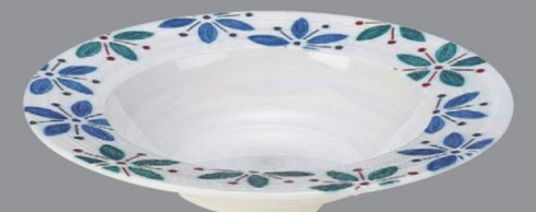
TC5-34-10 ¥2,850 235クーブ深皿 白渦蝶々花 φ235×45 (400ml) 150℃ PBT (88019485)