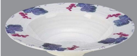
TC5-34-6 ¥2,850 235クーブ深皿 白渦グレープ φ235×45 (400ml) 150℃ PBT (88019450)