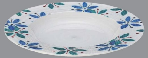
TC5-34-5 ¥2,850 238クーブ浅皿 白渦蝶々花 φ238×30 (290ml) 150℃ PBT (88019440)