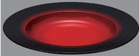
TC5-34-3 ¥3,250 238クーブ浅皿 朱黒ぼかし 毘沙門天塗 φ238×30 (290ml) 150℃ PBT (88019420)