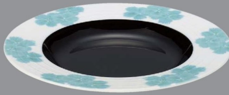
TC5-34-4 ¥2,850 238クーブ浅皿 なでしこ内黒 φ238×30 (290ml) 150℃ PBT (88019430)