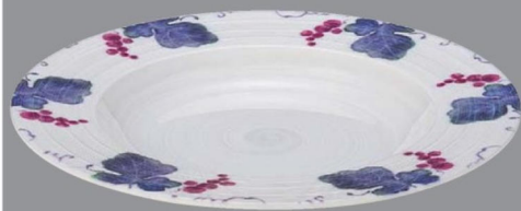
TC5-34-1 ¥2,900 238クーブ浅皿 白渦グレープ φ238×30 (290ml) 150℃ PBT (88019400)