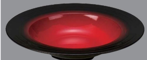
TC5-34-8 ¥3,300 235クーブ深皿 朱黒ぼかし 毘沙門天塗 φ235×45 (400ml) 150℃ PBT (88019470)