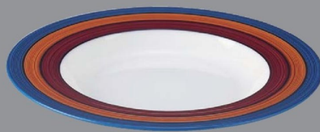
TC5-34-2 ¥2,900 238クーブ浅皿 スリーライン φ238×30 (290ml) 150℃ PBT (88019410)