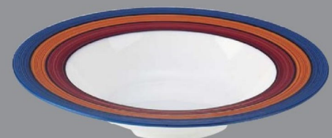
TC5-34-7 ¥2,850 235クーブ深皿 スリーライン φ235×45 (400ml) 150℃ PBT (88019460)