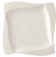
200-300 エンゼル四方角皿(小) 15×15×1.5cm 1,100円