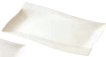
200-305 エンゼル長角皿(大) 30.5×18×3cm 3,100円