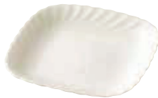
200-058 角プチケーキ 14.6×14.6×2cm 850円