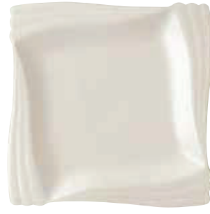
200-302 エンゼル四方角皿(大) 24.5×24.5×2.5cm 3,100円