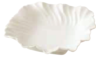
200-096 花型ボール(大) 19.5×19.5×4.9cm 2,700円