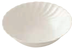
200-016 6.5"オートミル φ16.5×5.2cm 950円