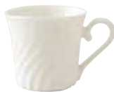
200-039 マグカップ φ8.6×8.1cm 220cc 1,100円