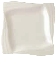
200-301 エンゼル四方角皿(中) 19.3×19.3×2cm 2,100円