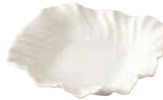
200-095 花型ボール(小) 15×15×3.9cm 1,000円