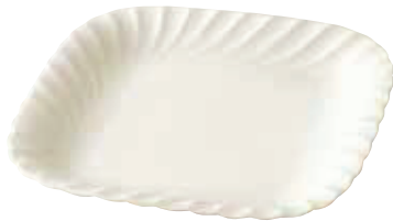
200-059 角パスタ 22.3×22.3×3.4cm 2,200円