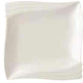
200-303 エンゼル二方角皿 22×21.6×2.8cm 2,800円