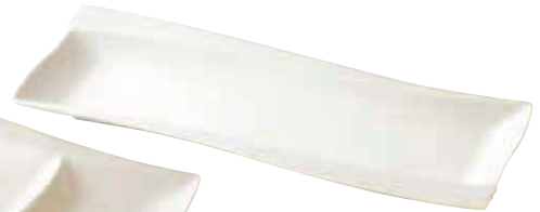
200-308 エンゼルロングプレート 33.3×11.7×2.5cm 2,800円