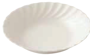
200-018 7.5"クープスープ φ19×4cm 1,100円