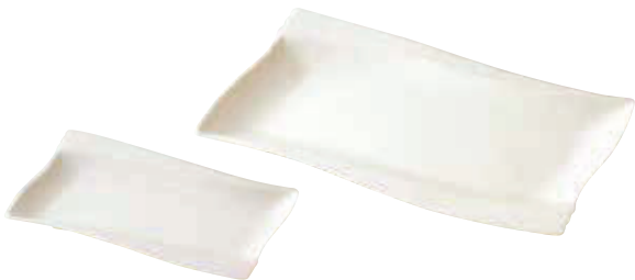
200-306 エンゼル長角皿(小) 19.8×11.8×2.8cm 1,300円