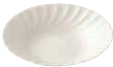
200-015 5.5"フルーツ φ14.5×3.2cm 750円