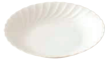
200-021 8.5"スープ φ22×3.8cm 1,300円