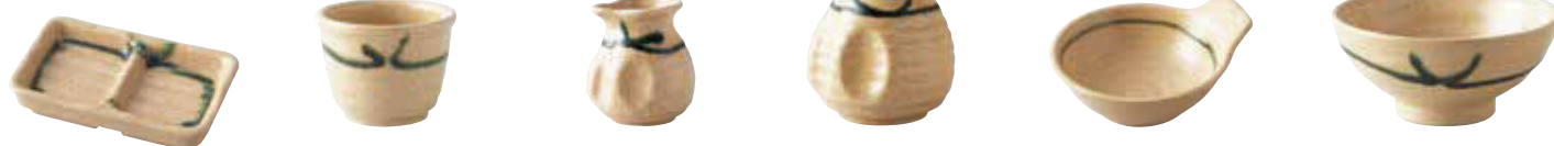
015-589 薬味皿 12.8×8×2.8cm 600円