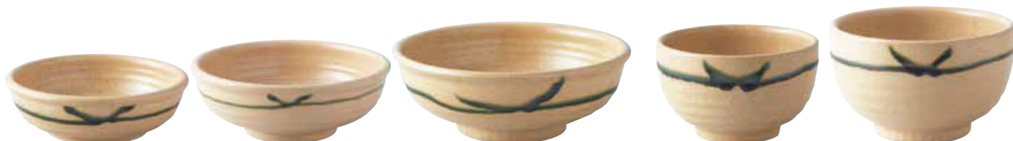
015-555 玉淵5.5浅井 φ17×6cm 1,200円