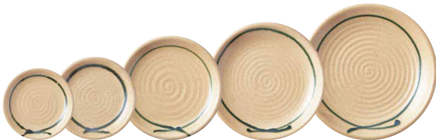
015-505 5.0皿 φ15.2×2cm 900円