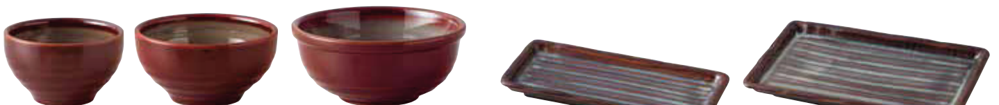
008-538 3.8なつめ小鉢 φ11×6.7cm 950円