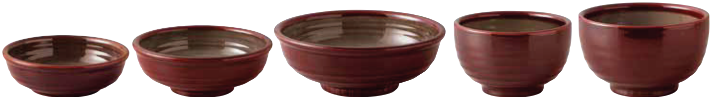
008-555 玉淵5.5浅井 φ17×6cm 1,200円