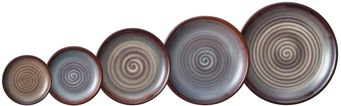
008-505 5.0皿 φ15.2×2cm 900円