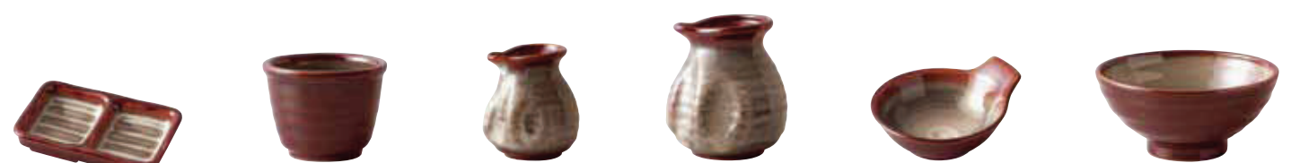
008-589 葉味皿 12.8×8×2.8cm 600円