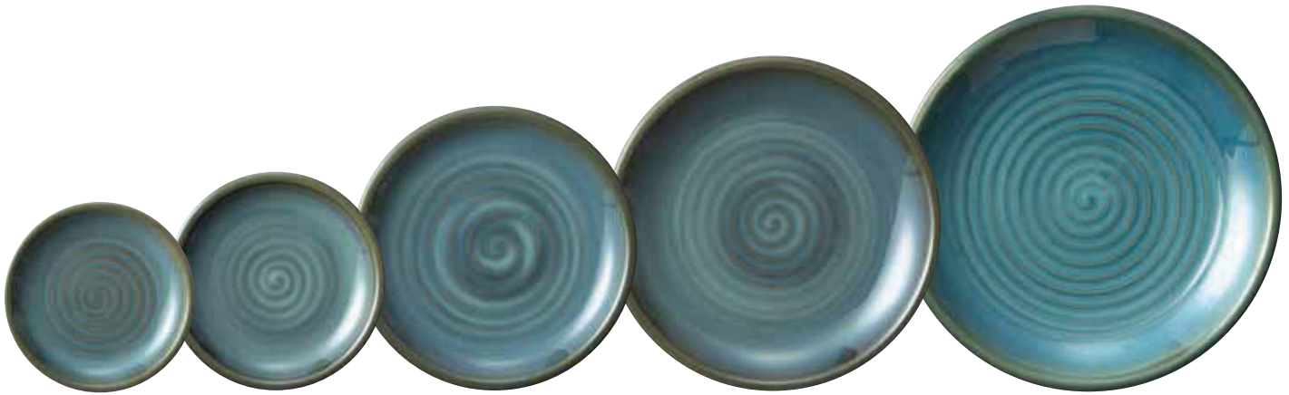
011-505 5.0皿 φ15.2×2cm 900円