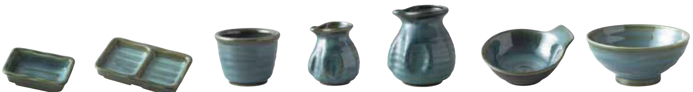
011-534 角ちよく 9.5×6.2×3.4cm 550円