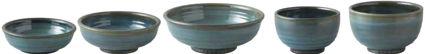
011-555 玉淵5.5浅井 φ17×6cm 1,200円