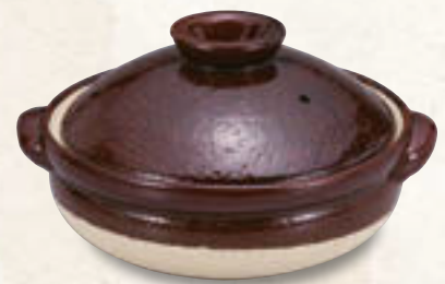
668-407-812 7,800円 伊賀焼 アメ8.5深鍋(28×26×16.5) 970830181 668-408-812 4,000円 伊賀焼 アメ6.5深鍋(24×20×12.5) 970830281 668-409-812 3,600円 伊賀焼 アメ6.0深鍋(22.5×18×11) 970830381