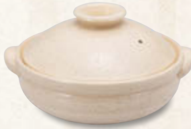
668-404-812 7,800円 伊賀焼 黄地8.5深鍋(28×26×16.5) 970830781 668-405-812 4,000円 伊賀焼 黄地6.5深鍋(24×20×12.5) 970830881 668-406-812 3,600円 伊賀焼 黄地6.0深鍋(22.5×18×11) 970830981