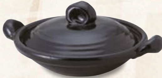
668-104-812 15,000円 艶黒スッポン9.0鍋(33×27×16) 563910181 668-105-812 11,500円 艶黒スッポン7.0鍋(27×21×13) 563910281