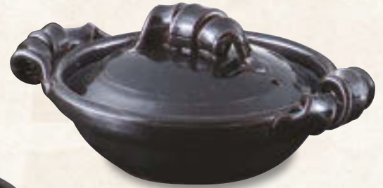
668-106-812 20,000円 艶黒10.0鍋(35×30×17) 563930181 668-107-812 16,000円 艶黒9.0鍋(32×27×15) 563930281 668-108-812 14,000円 艶黒8.0鍋(29×24×15) 563930381 668-109-812 11,500円 艶黒7.0鍋(26×21×14) 563930481