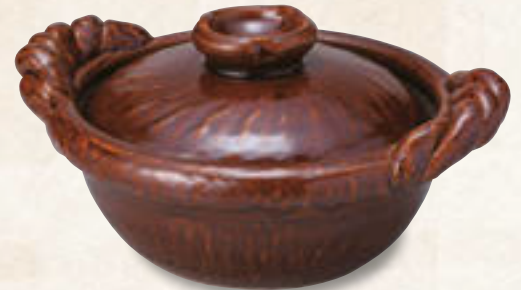
668-206-812 22,000円 あめ釉10.0鍋(36×30.5×18) 867610881 668-207-812 19,000円 あめ釉9.0鍋(33×28×16) 867610981 668-208-812 16,000円 あめ釉8.0鍋(30×25×14) 867611081 668-209-812 13,500円 あめ釉7.0鍋(27×21.5×13) 867611181