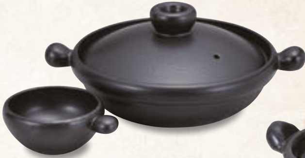
668-101-812 9,500円 厚口9.0鍋(黒) (34×28×16) 564130781 668-102-812 5,500円 厚口7.0鍋(黒) (28×22×13) 564130881 668-103-812 1,400円 耐熱小鉢(黒) (15×12×5.5) 564130981