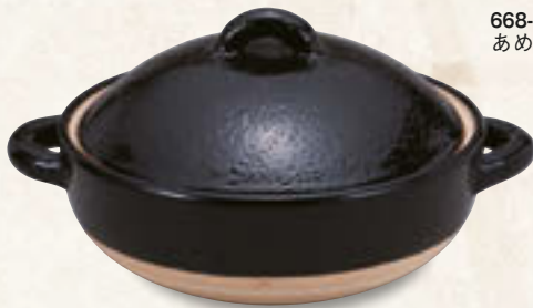
668-301-812 10,000円 伊賀ツヤ黒9.0鍋(31.5×26×17) 1070930181 668-302-812 4,800円 伊賀ツヤ黒6.0鍋(22×18.5×12) 1070930281