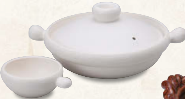
668-201-812 9,500円 厚口9.0鍋(白) (34×28×16) 564131081 668-202-812 5,500円 厚口7.0鍋(白) (28×22×13) 564131181 668-203-812 1,400円 耐熱小鉢(白) (15×12×5.5) 564131281