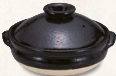
668-401-812 7,800円 伊賀焼 天目8.5深鍋(28×26×16.5) 970830481 668-402-812 4,000円 伊賀焼 天目6.5深鍋(24×20×12.5) 970830581 668-403-812 3,600円 伊賀焼 天目6.0深鍋(22.5×18×11) 970830681