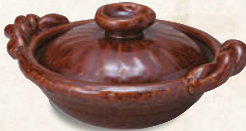
668-204-812 17,000円 あめ釉スッポン9.0鍋(35×28.5×14) 867620381 668-205-812 13,500円 あめ釉スッポン7.0鍋(27×22×12.5) 867630381