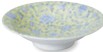
655-105-612 1,500円 唐彩7.0丸高台皿(21×5.3) 969310661