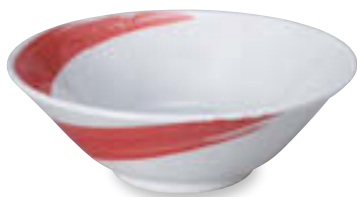
655-501-262 1,100円 赤刷毛7.0切立井(21.5×7.3-1090cc) 865930326 655-502-262 840円 赤刷毛6.5切立井(19.5×6.5-830cc) 865930426