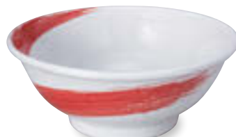
655-503-262 1,750円 赤刷毛7.0反高台井(21.4×8.7-1320cc) 865930126