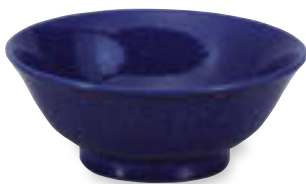
655-401-252 4,350円 ブルーマーブル7.0反高台井(21.3×8.8-1300cc) 560230425