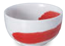
655-505-262 700円 赤刷毛多用碗(12.8×7-560cc) 865930526