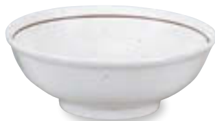
655-302-252 3,600円 粉引ライン玉淵7.0井(21.5×8-1400cc) 560240625