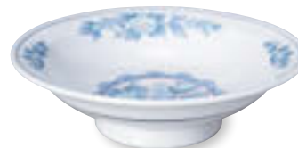
655-206-262 2,400円 三色牡丹7.0高台皿(21.3×5.9) 865820726