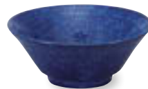
655-403-252 2,250円 ブルーマーブル4.8ライス(15×6.2-360cc) 560230325