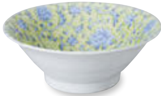
655-101-612 1,600円 唐彩7.0高台井(21.3×7.8-1270cc) 969310161 655-102-612 1,300円 唐彩6.5高台井(19.5×7.6-1100cc) 969310261