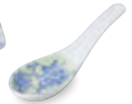
655-107-612 620円 唐彩レンゲ(4.5×14.5×4.3) 969310761