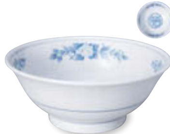
655-204-262 2,800円 三色牡丹反高台7.0井(21.5×8.5-1400cc) 865820126 655-205-262 2,450円 三色牡丹反高台6.5井(20.3×8.3-1200cc) 865820226