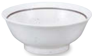
655-301-252 2,300円 粉引ライン反6.8高台井(21×8.5-1300cc) 560240525