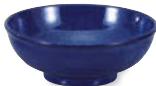
655-402-252 6,000円 ブルーマーブル7.0玉井(21.5×8-1400cc) 560230525