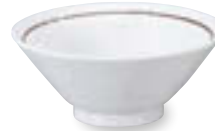
655-304-252 1,300円 粉引ライン4.8ライス(15×6.5-360cc) 560240325