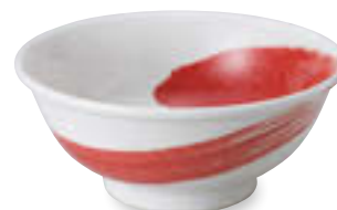
655-504-262 1,400円 赤刷毛6.8反高台井(20.3×8.5-1230cc) 865930226