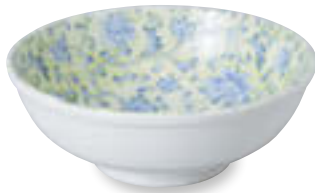
655-103-612 2,000円 唐彩6.5玉井(19.5×7.2-1100cc) 969310361 655-104-612 1,500円 唐彩5.0玉井(15.5×6-550cc) 969310461