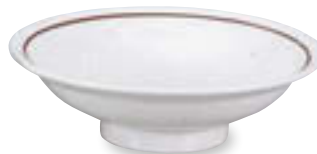
655-303-252 1,950円 粉引ライン7.0丸高台皿(22×6.3) 560240425