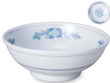
655-201-262 7,400円 三色牡丹8.0玉井(25.5×9.5-2380cc) 865820326 655-202-262 4,500円 三色牡丹7.0玉井(22×8.7-1560cc) 865820426 655-203-262 3,300円 三色牡丹6.5玉井(19.6×7.5-1150cc) 865820526