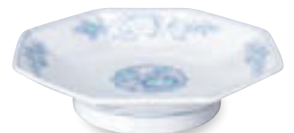
655-207-262 2,550円 三色牡丹6.5八角高台皿(19.5×4.5) 865820626